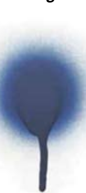
Spritzbild Standard Lackspray